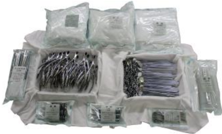
貸出器材例（イメージ）